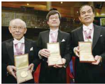
▲2014年ノーベル物理学賞受賞の赤崎勇氏、天野浩氏、中村修二氏