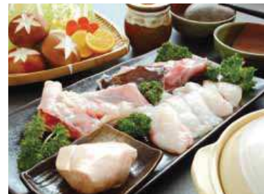
▲世界の人々を魅了する日本の食文化

目でした。すでに日本料理は世界各国で圧倒的な支持を得ており、農林水産省が外務省などを通じて行った調査では海外の日本食レストランの数は2013年時点で約5万5千店に達しています。また、同年には国内最高峰の富士山も「富士山―信仰の対象と芸術の源泉」としてユネスコの世界文化遺産に登録され、さらには、2020年夏季五輪の開催都市に東京が選ばれるなど、文化面でも日本が脚光を浴びた年でした。この年の「今年の漢字」の「輪」をはじめ、4位「東」、5位「風」、6位「決」、9位「富」、10位「喜」など、これらに関連するものが数多くベスト10入りしました。