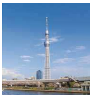
▲自立式電波塔として高さ世界一の634メートル

一を誇り、全建造物の中でもアラブ首長国連邦・ドバイのブルジュ・ハリファに次いで第2位(開業時点。首都圏の新たなランドマークとして話題を独占し、新時代の観光名所になっています。地上350メートルにある「展望デッキ」は5メートル以上の高さのガラス越しに360度の展望が楽しめる、地上450メートル「展望回廊」では空中散歩のような気分を味わうことができます。ちなみに、6位には「空」が入りました。