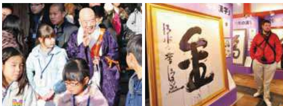
▲同時期に開催された「漢字が表す20年の世相展」。約5万人が来場した。(期間:2014年12月1日~12月26日 会場:清水寺経堂)