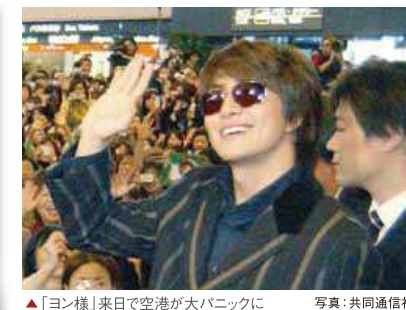
▲「ヨン様」来日で空港が大パニックに

「韓流」が横綱に選出されました。「韓」がこの年の応募数2位となり、「ヨン様グッズ」の購入で、ヨンゲル(エンゲル)係数が上がり、貧乏に...といった「選出の声」も寄せられました。 ツアーもマスコミのスポッライトを浴び、日本経済新聞社の日経MJ「2004年ヒット商品番付」でも「韓」がこの年の応募数2位となり、「ヨン様グッズ」の購入で、ヨンゲル(エンゲル)係数が上がり、貧乏に...といった