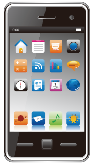
▲日本を席巻したスマホブーム元年 ※iPhone4はアップルの、Xperiaはソニーの登録商標です。

もはや従来型携帯電話は「ガラケー」と呼ばれ、パソコンに匹敵するほどの多機能を有するスマートフォンが今日の主流ですが、この普及が一気に加速したのが2010年でした。「iPhone4」「Xperia」が大ヒットするなど、スマートフォンは情報誌『日経トレンディ』の「年間ヒット商品」の3位に浮上し、翌年には1位を獲得しています。ベスト10入りの「熱」にふさわしいスマホブームが日本を席巻した年でした。