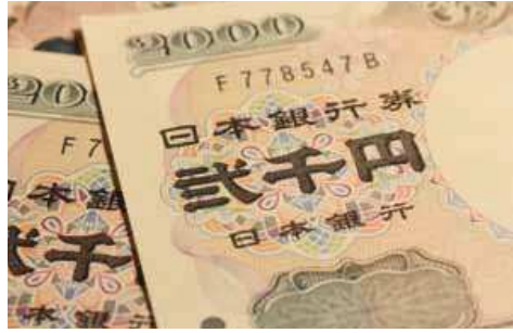
▲沖縄サミットの年に二千円札発行

20世紀最後の年、第26回主要国首脳会議（沖縄サミット）と西暦2000年にちなんで、前年に当時の小淵恵三内閣総理大臣の発案により森喜朗内閣のもとで二千円札