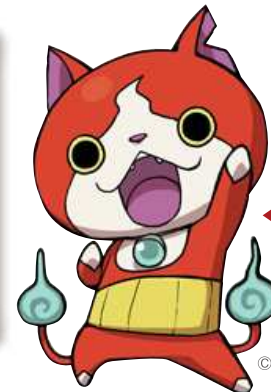
▲「妖怪ウォッチ」キャラクター ジバニヤン

アニメ映画賞を受賞。主題歌「レット・ナイト・ゴー」も多くの人々を魅了しました。「妖怪ウォッチ」は前年夏にニンテンドー3DS用ソフト第一弾が発売され、この年の1月に放送が開始されたテレビアニメ版でブレイク。妖怪メダルは2014年の1年間で1億7千万枚を販売、社会現象を巻き起こしました。