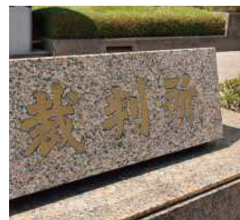
▲最初の公判は東京地方裁判所で実施

「新たな時代」がはじまったのです。この年、日本の司法、裁判制度の挙の有権者(市民)から無作為に選ばれ、裁判官と共に裁判に臨みます。対象となるのは地方裁判所で実施される刑事裁判の内、殺人、身代金目的誘拐などの重大な犯罪です。裁判は原則として裁判員6名、裁判官3名の合議体で行われます。2009年の制度開始から本年3月末までに約5万8千人が職務を遂行しています。