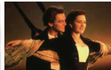
▲教科書にも登場した大ヒット映画「タイタニック」 タイタニック<2枚組>ブルーレイ発売中 ¥1,905+税 20世紀フォックス ホーム エンターテイメント ジャパン ©2013 Twentieth Century Fox Home Entertainment LLC. All Rights Reserved.