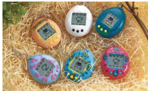
▲世界各国でも空前の大ブーム たまごっち(写真は1996年発売品)

ブームを巻き起こしました。同じ年に「プリクラ」人気にも火が付き、流行りのルーズソックスを履いた女子高生たちがアミューズメントパークなどに通い詰まりました。