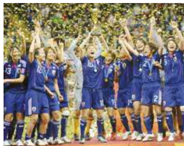
▲悲願の初優勝に日本中の人々が喝采