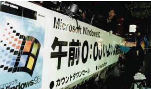
▲脚光を浴びてWindows95新発売