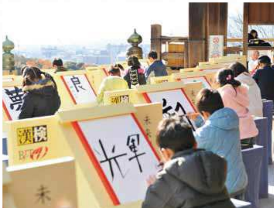
▲応募者の中から抽選で選ばれた20名が、清水の舞台で想いの「未来の漢字」を発表。