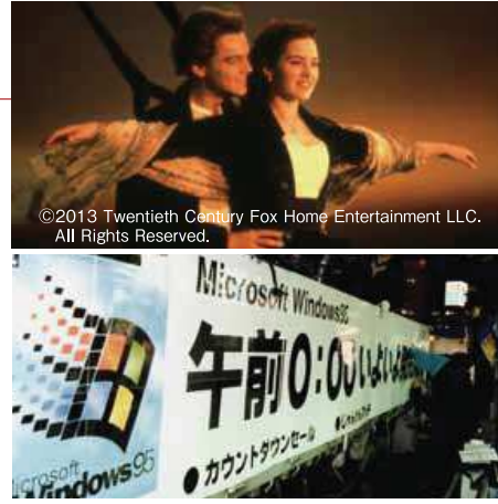
©2013 Twentieth Century Fox Home Entertainment LLC. All Rights Reserved.

この年、「今年」の漢字「食」に選ばれたのは「食」。0157という腸管出血性大腸菌による集団食中毒の発生、税金と福祉を「食いもの」にした汚職事件などの世相を反映した選出でしたが、「飼育」というテーマ設定で社会現象になるほど大ヒットしたのが「たまごっち」。液晶画面の中の卵をかえし育てていくというパズルゲームです。発売元はバンダイで、「たまご」と「ウオッチ」から名づけられた「たまごっち」は海外でも続々と発売され、世界各国で大