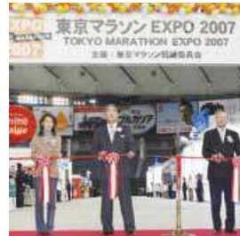
▲参加希望者の抽選倍率は年々増加

ショ/あつい 平均気温が観測史上最高を記録して熱中症が続出。また、チリ火山事故で暑い地中から作業員全員が生還。 2位「中」 3位「不」 4位「乱」 5位「興」 6位「国」 7位「高」 8位「嵐」 9位「熱」 10位「変」