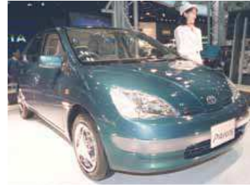
▲21世紀を先取りするエコカー ※「プリウス」はトヨタ自動車の登録商標です。

その年の「今年の漢字」に選ばれなくても、応募数上位の漢字には世相を鋭く突き、次代を予感させるものが少なくありません。たとえば、この年に世界初の量産ハイブリッド乗用車として発売されたトヨタ「プリウス」は、トップ10に入る「驚」がびつたりと21世紀型エコカーです。今日、世界各国を疾走するこのハイブリッド車の世界累計販売台数は実に、800万台を突破しています。