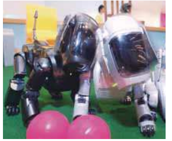
▲ロボット新時代の幕開け「AIBO」 ※AIBO®はソニー、Pepper®はソフトバンクの登録商標です。

「AIBO（アイボ）」が発売開始から約20分で予定の3,000台の受注を締め切る盛況でマスコミの脚光を浴び、「AIBO」の登場がロボット新時代の到来を告げました。現在では、世界初の感情認識パーソナルロボット「Pepper（ペッパー）」が注目されており、AI（人工知能）ロボットが心の友としての「癒」やしになる時代が訪れています。