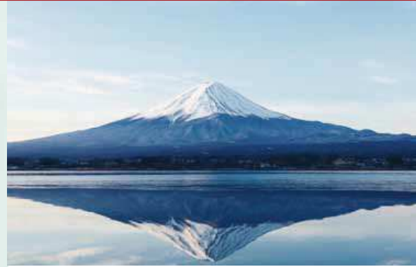
▲世界文化遺産に登録された富士山