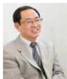
監修 佐竹 秀雄 当協会 現代語研究室 室長

「点滅している」「急いで」は修飾部分ですから、それらを省くと E 危険なので、青信号で渡るのをやめてください。 となつて、おかしな文ができあがってしまします。 修飾しているからといって、いつでも省けるわけではないのです。確かに、修飾部分を省くのが要約の原則ですが、修飾部分の中にも、大事な情報が潜んでいることがあります。それは、省けません。 要約のときには、元の文章が表している情報の中で、重要度の大小を見抜くことが必要なのです。それには、文章全体の中で、筆者が何を言いたいのかに気を配らなければなりません。文章全体を踏まえて、より重要な情報を残すこと、それが要約のコツなのです。